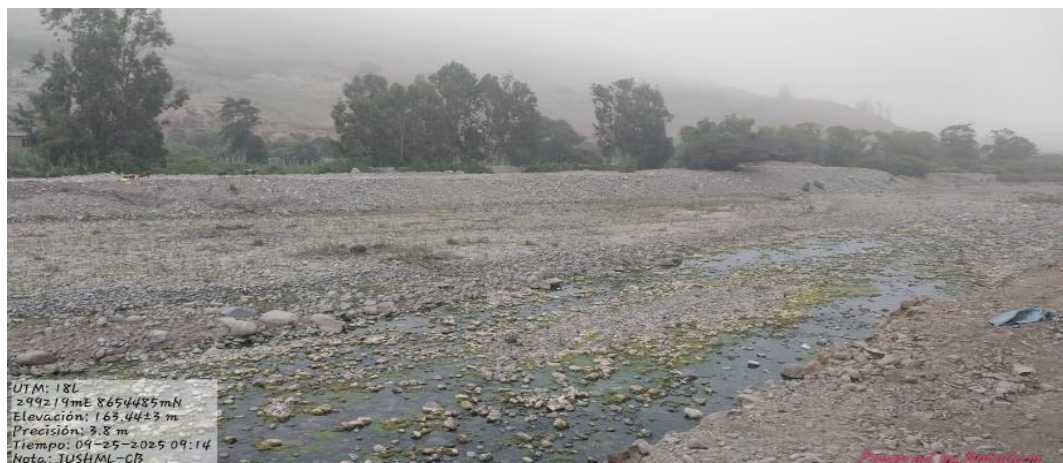
SECTOR MANCHAY ALTO