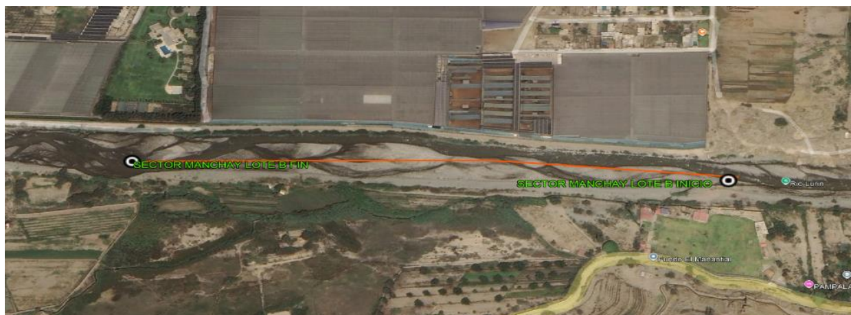
5.- IMAGEN SATELITAL DE ZONA VULNERABLE(GOOGLE EARTH)